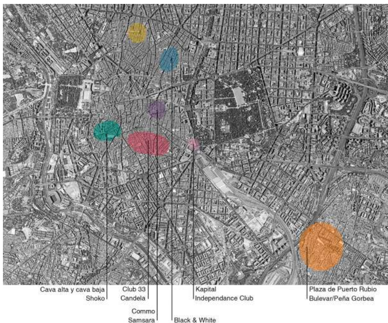
Mapa 1. Casos de estudio en la ciudad de Madrid [Leyenda: barrios de Malasaña (amarillo), Chueca (azul), huertas (morado), La Latina (verde), Lavapiés (rojo), Atocha (rosa) y San Diego (naranja)]

- Fase 5. Realización del trabajo de campo en profundidad (exclusiva para la ciudad de Madrid): entrevistas abiertas con grupos naturales de jóvenes y entrevistas semi-estructuradas con informantes clave del sector público y privado (Enero-Septiembre 2019). Entrevistas con expertos/as y agentes del tercer sector en el caso de Barcelona (Septiembre 2020).