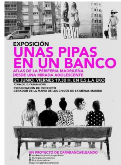
Imagen 2. Cartel proyecto Unas Pipas en un banco (Junio 2019)