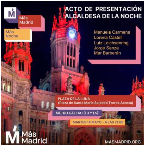
Imagen 1. Cartel presentación Alcaldesa de la noche (Mayo 2019)

Dada la coyuntura política en la ciudad de Madrid y el cambio en la composición del gobierno local en 2019, el proyecto de la Alcaldía de la Noche ha sido paralizado, y se están buscando alternativas para la activación de una red estable de trabajo que incluya también actores institucionales para el monitoreo del ocio nocturno de la ciudad. En segundo lugar, participamos en el encuentro organizado por el colectivo Carabancheleando en el que se presentaron los resultados y objetivos fundamentales del programa 'Pipas en un Banco', proyecto de trabajo con jóvenes que incluye una rama de ocio nocturno en el distrito de Carabanchel, y cuya presentación tuvo lugar en Junio 2019 (ver Imagen 2). En el futuro, tal y como se plantea en el Apartado de Conclusiones de este informe, el reto consiste en juntar ambos procesos y que los encuentros entre estas dos iniciativas, junto con las asociaciones de jóvenes, empresarios y asociaciones vecinales con quienes ya se ha establecido un contacto en firme en los últimos meses, pueda conformar en el futuro una red de trabajo estable en torno al ocio nocturno joven en la ciudad, independientemente de la configuración de gobierno que adopte la ciudad en cada etapa.