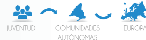
Foto fija que permite comparar de manera transversal el estado de la juventud española con la europea y también entre Comunidades Autónomas.

Extraído de un algoritmo que trabaja con las estadísticas de EUROSTAT y otras fuentes estadísticas españolas sobre educación, empleo, emancipación, vida y TIC en la población juvenil.