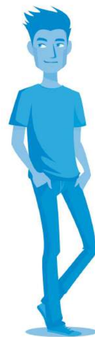
A LOS CHICOS