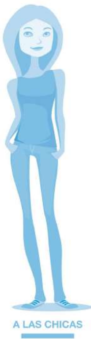
A LAS CHICAS

Esta investigación analiza los estereotipos en torno a lo que significa "ser chico" y "ser chica" para los adolescentes españoles de 14 a 19 años.